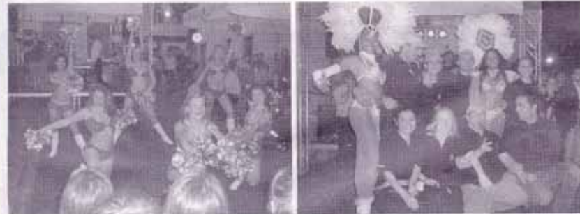
Die Cheerleaders der Frankfurt Galaxy und 2 brasilianische Schönheiten bei der Pizzeria Sicilia.