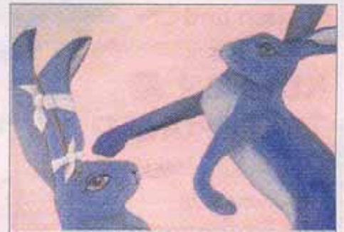
„Boxende Hasen“ (Ausschnitt), Öl (100 x 140 cm).